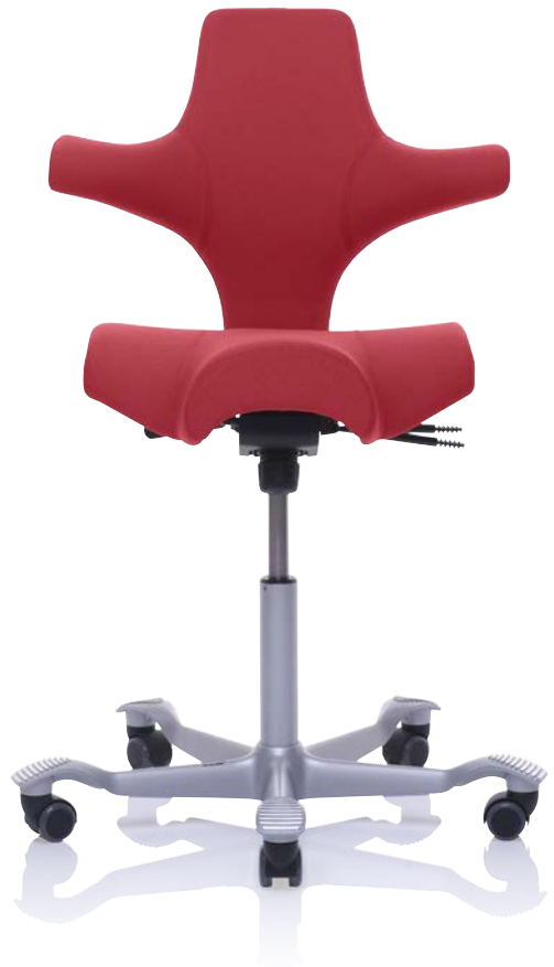
Design: Peter Opsvik. Patent- og designbeskyttet